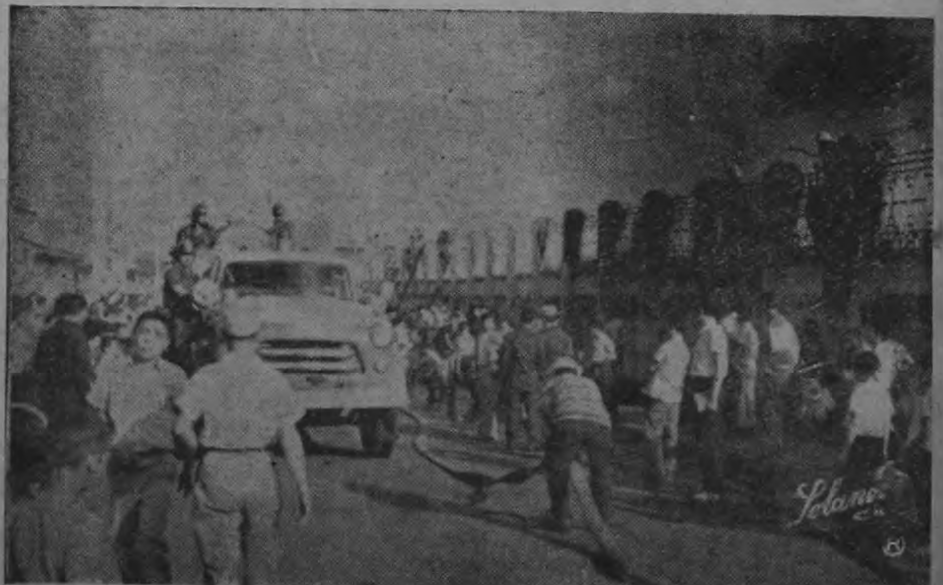
PANICO. La negra humareda y las llamaradas que brotaban de los vehículos incendiados alarmaron inmediatamente al vecindario, varios de cuyos autos estaban a no más de treinta metros de los tanques incendiados.

El Gobierno costarricense ha decidido que es más conveniente oír los argumentos de ambas partes para formar criterio y que esto sólo se lograría en una reunión de esa índole. —(TEXTO EN PAGINA 8)—