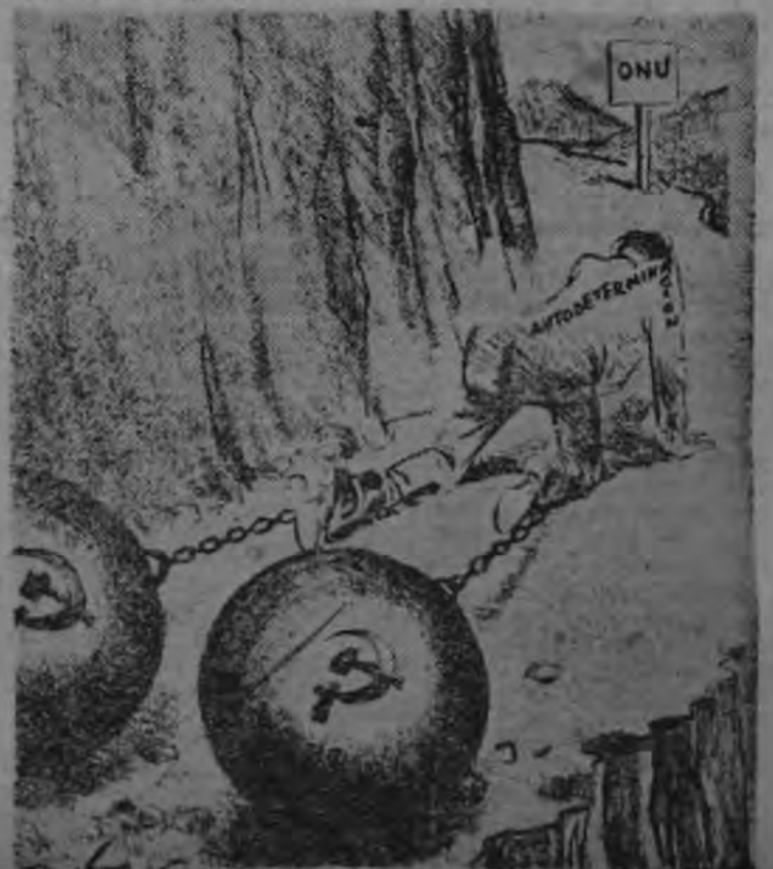
¿Cómo alcanzará la meta?

En el servicio exterior desde 1941, Bennett fue consejero político en la Embajada de Estados Unidos en Viena en 1957 y en la embajada en Atenas en 1961 con el rango de Ministro.