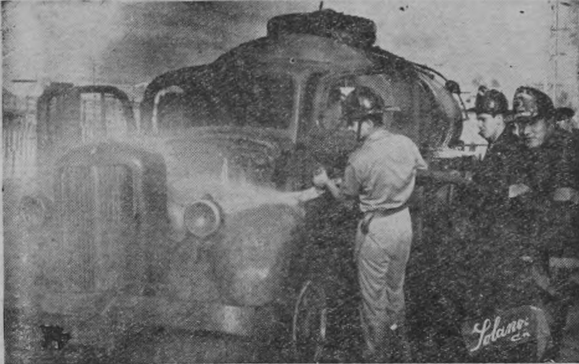
CONVERTIDO EN CHATARRA quedó el camión tanque del Ministerio de Transportes que cogió fuego cuando se cargaba de petróleo que succionaba

das al aire. Los ocho pasajeros, quienes resultaron providencialmente ilesos; salieron a gatas por las ventanillas.