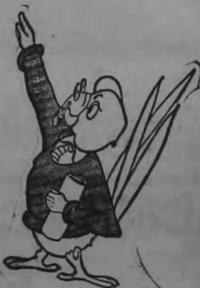
Juan Censo Discreto Dpto. Cartografía y Divulgación

La Patria necesita su valiosa colaboración, bríndesela usted como ciudadano responsable.