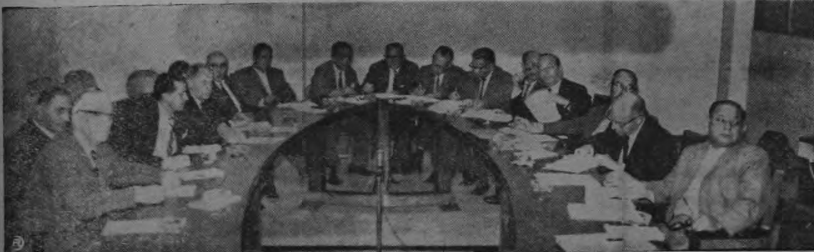
ASAMBLEA GENERAL de la Cámara de Comercio efectuada el jueves pasado donde se procedió a la elección de la nueva directiva para el período 1963-1964, de la que suministramos amplia información y la forma en que quedó integrada la Directiva. En la

Las obras a realizar este año incluyen vías públicas, parques, fuentes luminosas, cunetas, entubamientos, alcantarillas, aceras y muchas otras más. A pesar de que la precipitación de ceniza volcánica ha obligado al Municipio a un plan especial de limpieza para el que no había recurso, presupuestarios, de ningún modo descuidaremos la realización de obras, que son de urgente necesidad para distintos sectores de la comunidad, dijeron los funcionarios municipales informantes.