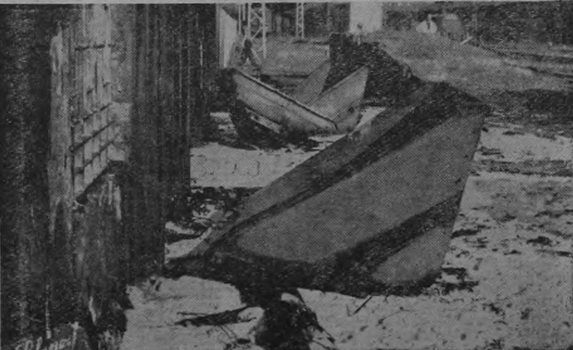
EL AREA FUE CUBIERTA TOTALMENTE con productos químicos especiales utilizados en casos de fuego de este tipo. Los bomberos llevaron un enor-

rro de trozas que estaba al lado del sitio en que se produjo el accidente. (Foto SOLANOV).